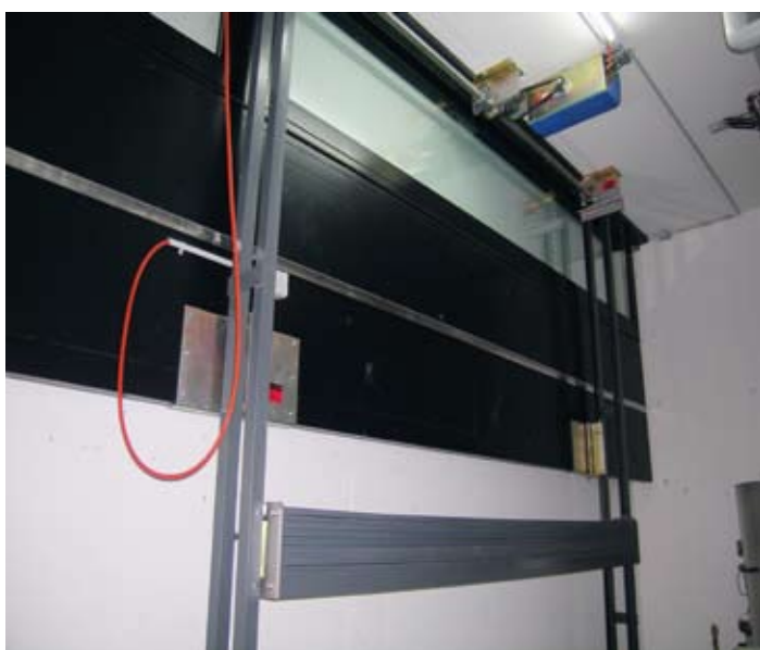
Die Mechanik offenbart sich im Keller. Ein Torantrieb sorgt über eine Kette und die Mitnehmer für den nötigen Auftrieb. Das rote Kabel ist für die Schliessüberwachung der Flügeltüre.